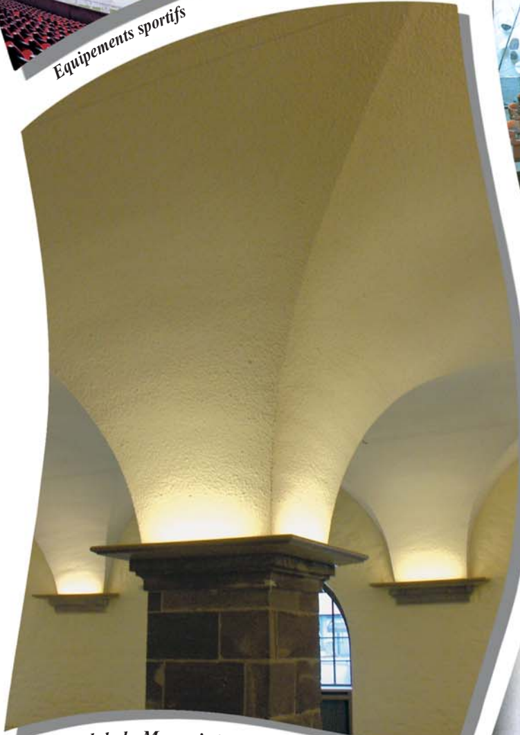
Hôtel de la Monnaie Molsheim - Salon Bugatti