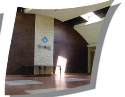
Salles des fêtes