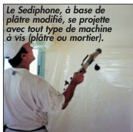
Le Sediphone, à base de plâtre modifié, se projette avec tout type de machine à vis (plâtre ou mortier).

L'applicateur doit particulièrement soigner la préparation et la fixation du support à traiter, car d'elles dépendent l'adhérence du SEDIPHONE® et sa pérennité.