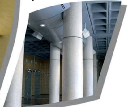
Salle de réceptions Conseil Régional région PACA