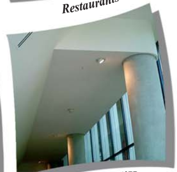
Palais des Droits de l'Homme Strasbourg